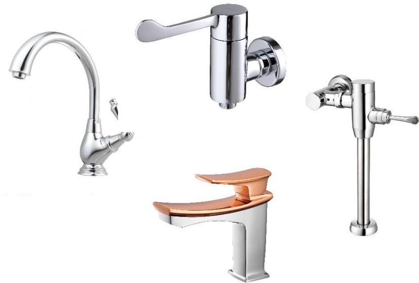
บริษัท สยามซานิทารีฟิตติ้งส์ จำกัด

เมื่อ วันที่ 19 ธันวาคม 2562 สถาบันสิ่งแวดล้อมไทย โดยฝ่ายเลขานุการคณะกรรมการรับรองการลดหรือหลีกเลี่ยงการปล่อยก๊าซเรือนกระจกได้ดำเนินการจัดประชุมคณะกรรมการรับรองฯ ครั้งที่ 17-5/2562 เพื่อพิจารณาให้การรับรองการขึ้นทะเบียนและต่ออายุฉลากลดคาร์บอน ที่ประชุมมีมติอนุมัติรับรองทั้งสิ้น 18 ผลิตภัณฑ์ จาก 5 บริษัท