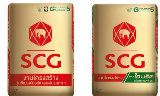
บริษัท เอสซีจี ซีเมนต์ จำกัด