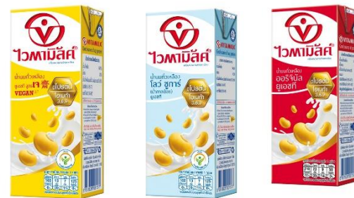
บริษัท กรีนสปอต จำกัด