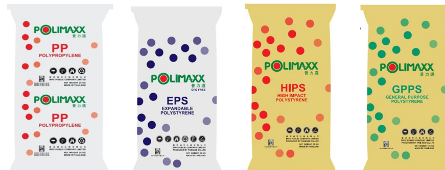
บริษัท ไออาร์พีซี จำกัด (มหาชน)